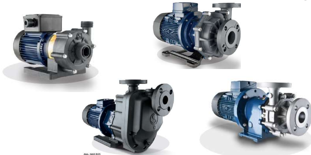
Abb.: MAS BGS Selbstansaugende Pumpen